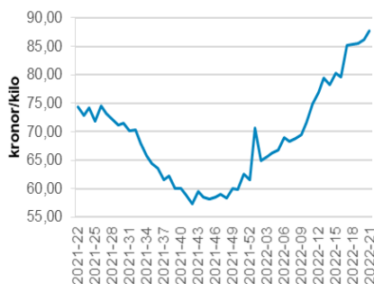
Avräkningspris lamm i Sverige och EU 2019-2022